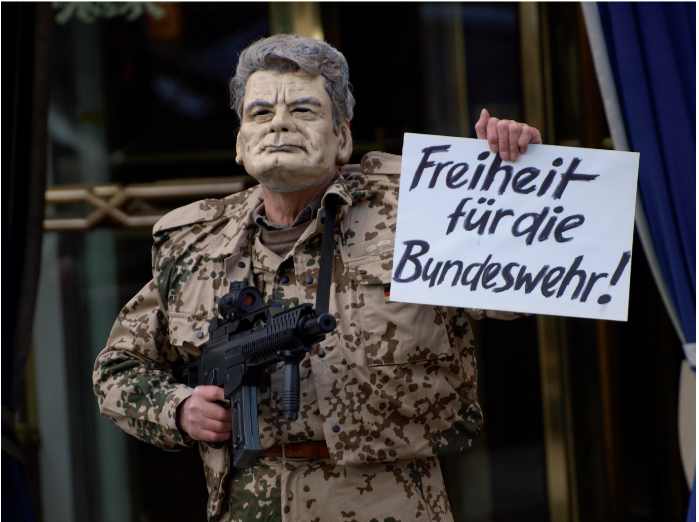
Protest gegen Gauck bei der Münchner Sicherheitskonferenz 2014