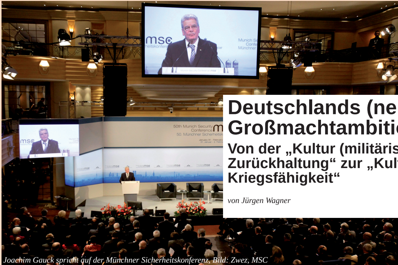
Joachim Gauck spricht auf der Münchner Sicherheitskonferenz