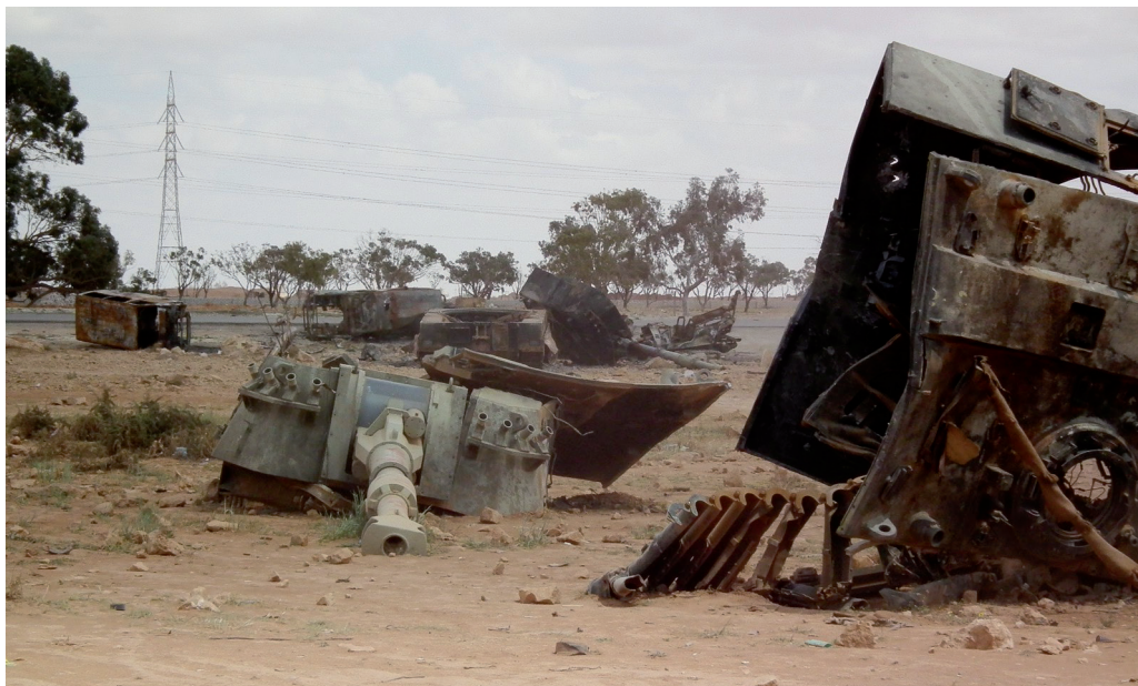
Libyen-Krieg: Hinterlassenschaften internationaler „Verantwortungspolitik“.

Bekanntlich hat der Westen bis heute (noch) nicht direkt militärisch in Syrien interveniert, die Tatsache aber, dass zumindest die Schwarz-Gelbe Bundesregierung ohnehin wenig Enthusiasmus an den Tag legte, den Verbündeten im Zweifelsfall beispringen